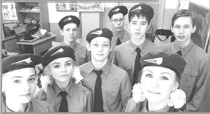
Как здорово быть одной командой!