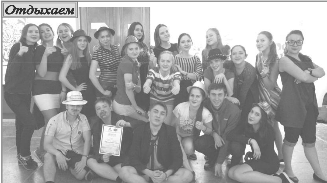
Артек останется в моем сердце навсегда!